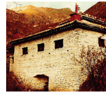
The "Temple Of Miraculous Fire" at Muktinath, Nepal. Photo by Ken Street (November 1979).

[For more on this subject, please read our tract The Temple Of Miraculous Fire. ]